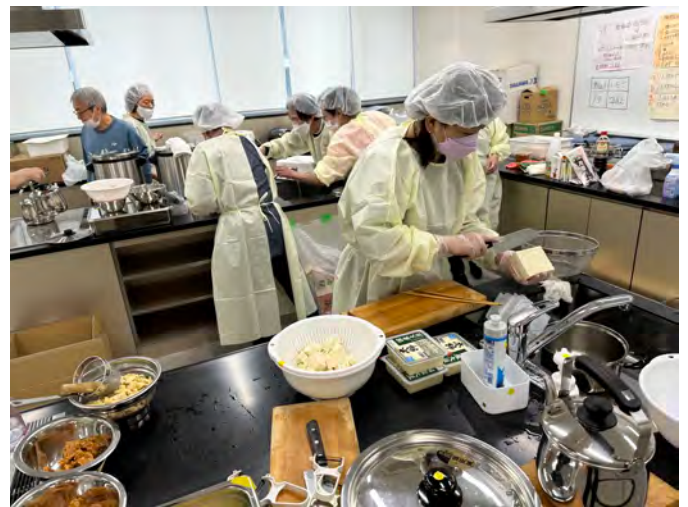
キッチンあまぬま