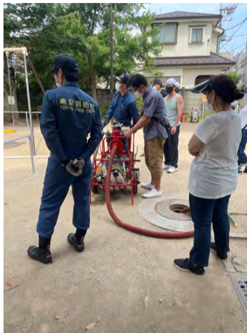
スタンドパイプ訓練