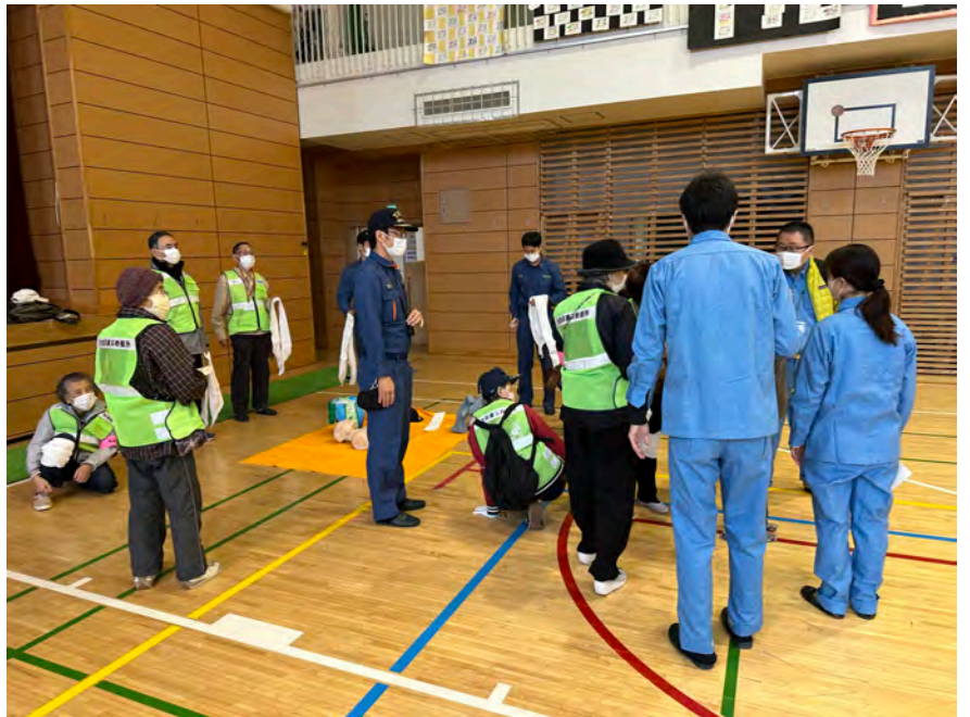
天沼小学校震災救援所訓練