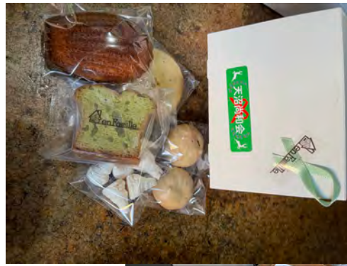
80歳以上の方への敬老品