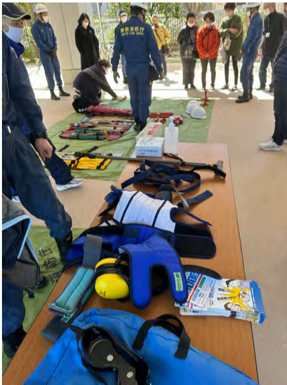
天沼地区町会連合会 防災訓練