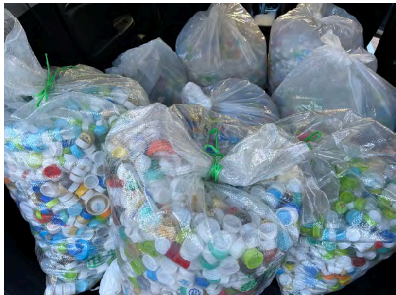
ペットボトルキャップ