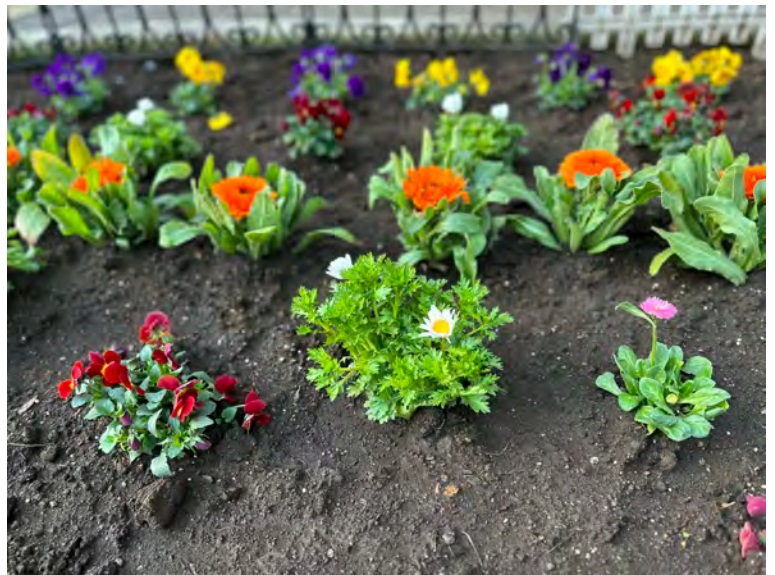
弁天池公園花咲かせ隊