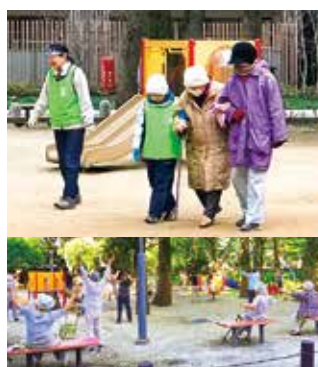
高齢者のサポート