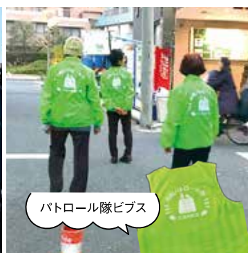
パトロール隊ピブス