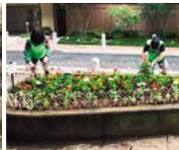
花咲かせ隊の活動（弁天池公園）