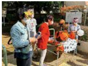
ハロウィンに参加