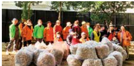
落ち葉感謝祭の活動

季節の行事や交流の場は、地域のつながりを深める大切な活動です。日頃から顔の見える関係を育てることが、防災・見守りにもつながり、災害時に助け合える地域づくりの土台になります。