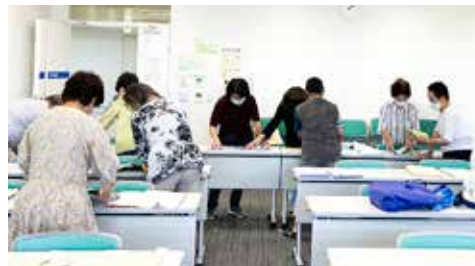
世話人会：月1回、回覧板のセットと行政からの連絡事項の説明と地域の情報交換