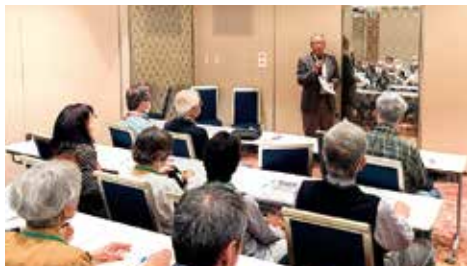
総会（各部報告と収支報告）・懇親会