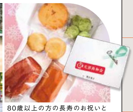
80歳以上の方の長寿のお祝いと高齢者名簿の作成